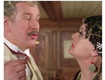
1977 MORT SUR LE NIL (Death on the Nile) de John Guillermin avec Peter Ustinov