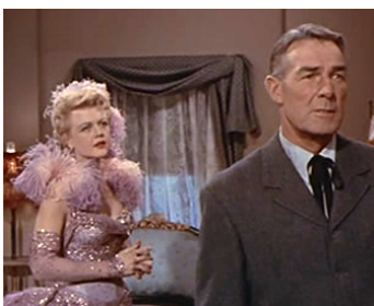
1955 LA POUDRE PARLE (A Lawless Street) de Joseph H. Lewis avec Randolph Scott