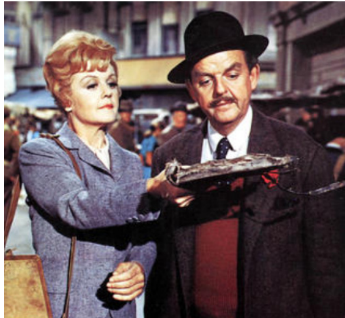
1971 L'APPRENTIE SORCIÈRE (Bedknobs and Broomsticks) de Robert Stevenson avec David Tomlinson