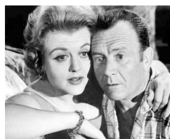
1959 CHAQUE ÉTÉ L'AMOUR RENAÎT (Season of Passion) de Leslie Norman avec John Mills