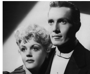
1944 LE PORTRAIT DE DORIAN GRAY (The Picture of D. Gray) d'Albert Lewin avec Hurd Hatfield