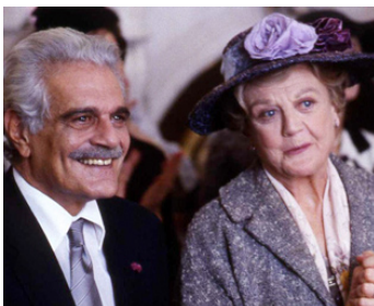
1992 TOUS LES RÊVES SONT PERMIS (Mrs Arris goes to Paris) d'Anthony Shaw avec O. Sharif