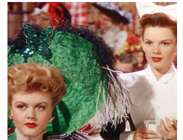
1946 LES DEMOISELLES HARVEY (The Harvey Girls) de George Sidney avec Judy Garland