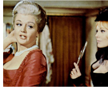
1964 MOLL FLANDERS (Moll Flanders) de Terence Young avec Kim Novak