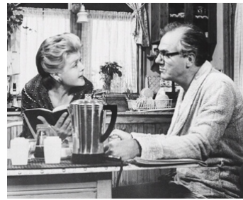
1961 L'ANGE DE LA VIOLENCE (All Fall Down) de J. Frankenheimer avec Karl Malden