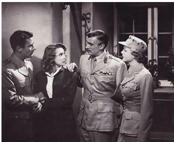
1949 LE DANUBE ROUGE (The Red Danube) de G. Sidney avec P. Lawford, J. Leigh, W. Pidgeon