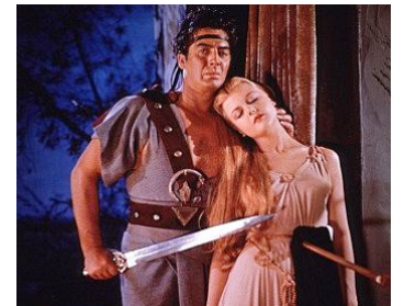
1949 SAMSON ET DALILA (Samson and Delilah) de Cecil B. De Mille avec Victor Mature