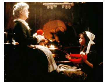
1984 LA COMPAGNIE DES LOUPS (The Company of Wolves) de Neil Jordan avec Susan Patterson