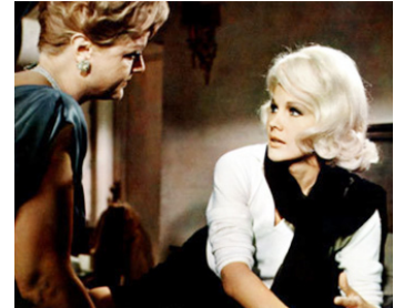
1965 HARLOW, LA BLONDE PLATINE (Harlow) de Gordon Douglas avec Carroll Baker