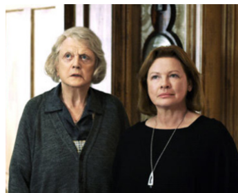
2004 THE BLACKWATER LIGHTSHIP de John Erman avec Dianne Wiest