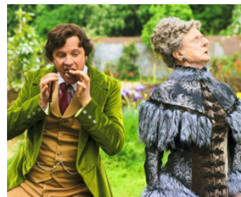
2005 NANNY McPHEE (Nanny McPhee) de Kirk Jones avec Colin Firth