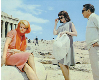
1962 LES CHEMINS DE LA VENGEANCE (In the Cool of the Day) de R. Stevens avec J. Fonda, P. Finch