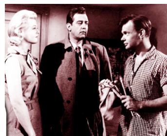
1956 PLEASE MURDER ME de Peter Godfrey avec Raymond Burr, Dick Foran