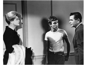
1964 DEAR HEART (Dear Heart) de Delbert Mann avec Michael Anderson Jr, Glenn Ford