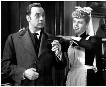
1944 HANTISE (Gaslight) de George Cukor avec Charles Boyer