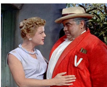
1958 LES FEUX DE L'ÉTÉ (The long hot Summer) de Martin Ritt avec Orson Welles