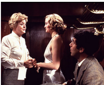
1978 UNE FEMME DISPARAÎT (A Lady vanishes) d'A. Page avec Cybil Shepherd, Elliott Gould