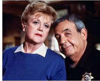
1963 DEUX COPINES, UN SÉDUCTEUR (The World of Henry Orient) de G. Roy Hill avec Tom Bosley