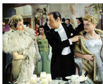
1958 THE RELUCTANT DEBUTANTE de Vincente Minnelli avec Kay Kendall, Rex Harrison