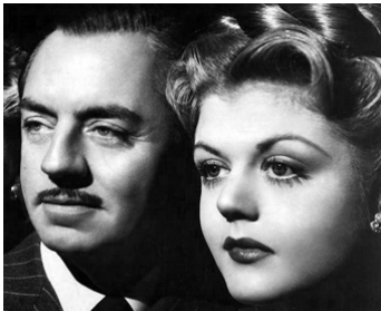
1946 THE HOODLUM SAINT de Norman Taurog avec William Powell