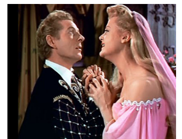
1956 LE BOUFFON DU ROI (The Court Jester) de M. Frank & N. Panama avec Danny Kaye