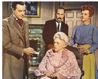
1951 FEMME EN PÉRIL (Kind Lady) de J. Sturges avec G. Sanders, K. Wynn, Ethel Barrymore