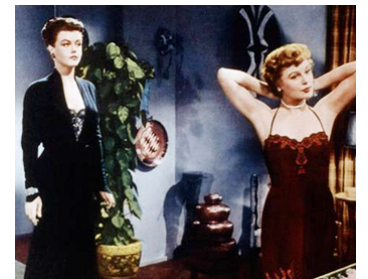
1953 DRÔLE DE MEURTRE (Remains to be seen) de Don Weis avec June Allyson