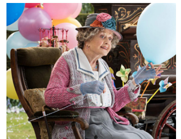
2018 LE RETOUR DE MARY POPPINS (Mary Poppins returns) de Rob Marshall