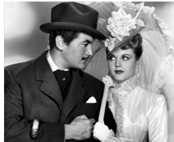
1947 BEL-AMI (The private affairs of Bel Ami) d'Albert Lewin avec George Sanders