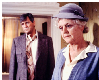
1980 LE MIROIR SE BRISA (The Mirror crack'd) de Guy Hamilton avec Rock Hudson