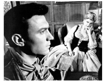
1962 UN CRIME DANS LA TÊTE (The Manchurian Candidate) de J. Frankenheimer avec L. Harvey