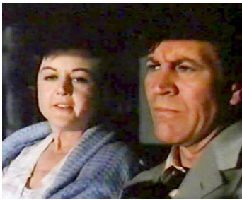
1960 OMBRE SUR NOTRE AMOUR (The Dark at the top of the stairs) de Delbert Mann avec R. Preston