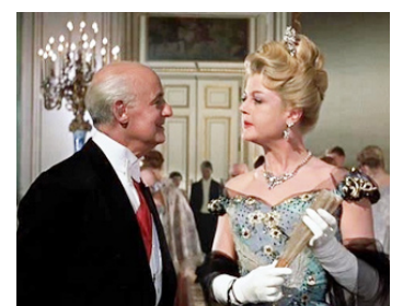
1960 SCANDALE À LA COUR (A Breath of Scandal) de M. Curtiz avec Tulio Carminati