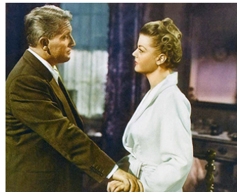
1948 L'ENJEU (State of the Union) de Frank Capra avec Spencer Tracy