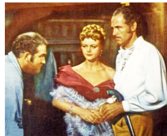
1951 MUTINERIE À BORD (Mutiny) d'Edward Dmytryk avec Patric Knowles