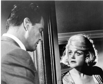
1965 ÉNIGME À 4 INCONNUES (Mr Budding) de Delbert Mann avec James Garner