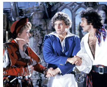
1982 THE PIRATES OF PENZANCE de Wilford Leach avec Rex Smith, Kevin Kline