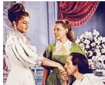
1948 LES 3 MOUSQUETAIRES (The 3 Musketeers) de G. Sidney avec June Allyson, Gene Kelly