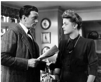
1947 QUAND VIENT L'HIVER (If Winter comes) de Victor Saville avec Walter Pidgeon