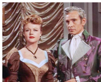
1955 LE CAVALIER AU MASQUE (The Purple Mask) de B. Humberstone avec Dan O'Herlihy