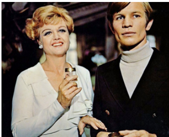
1970 SOMETHING FOR EVERYONE d'Harold Prince avec Michael York