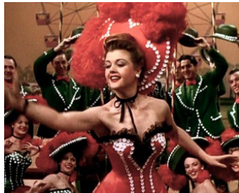
1946 LA PLUIE QUI CHANTE (Till the clouds roll by) de Richard Whorf