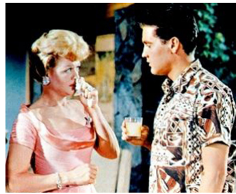
1961 SOUS LE CIEL BLEU D'HAWAII (Blue Hawaii) de Norman Taurog avec Elvis Presley